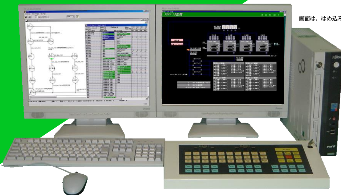
画面は、はめ込み合成です

使いやすいスタジオオーネの機能をユーティリティ監視に特化 簡単にユーザーの望む監視画面、データ収集を実現