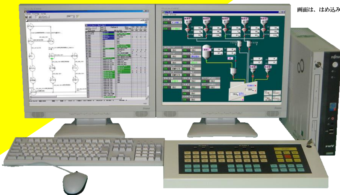
画面は、はめ込み合成です

資産継承を保証するデータ駆動方式 スタジオオーネVer5、Ver6.0システムと混在可能